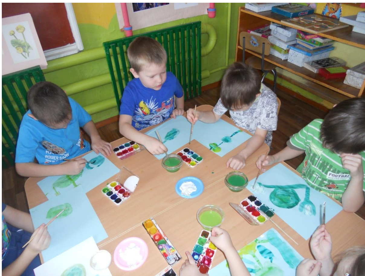
Рисуем кувшинки и кубышки – редкие водные растения.