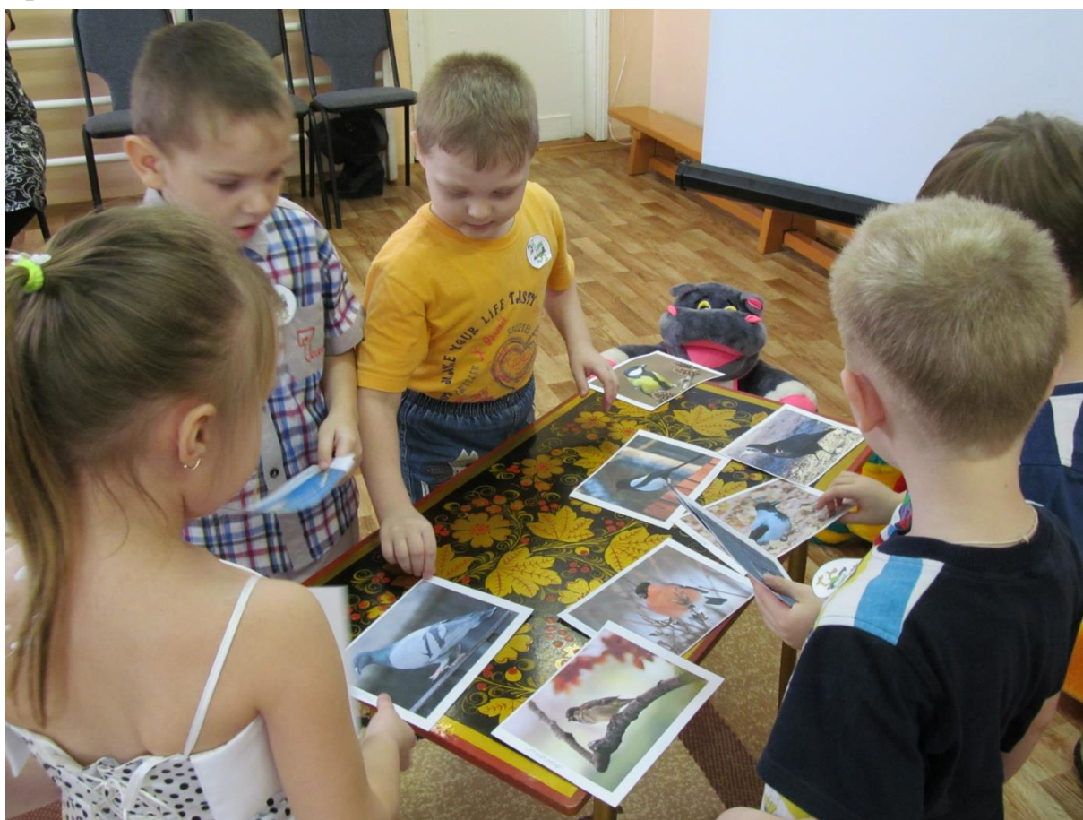
Конкурс 1 «Найди животное»