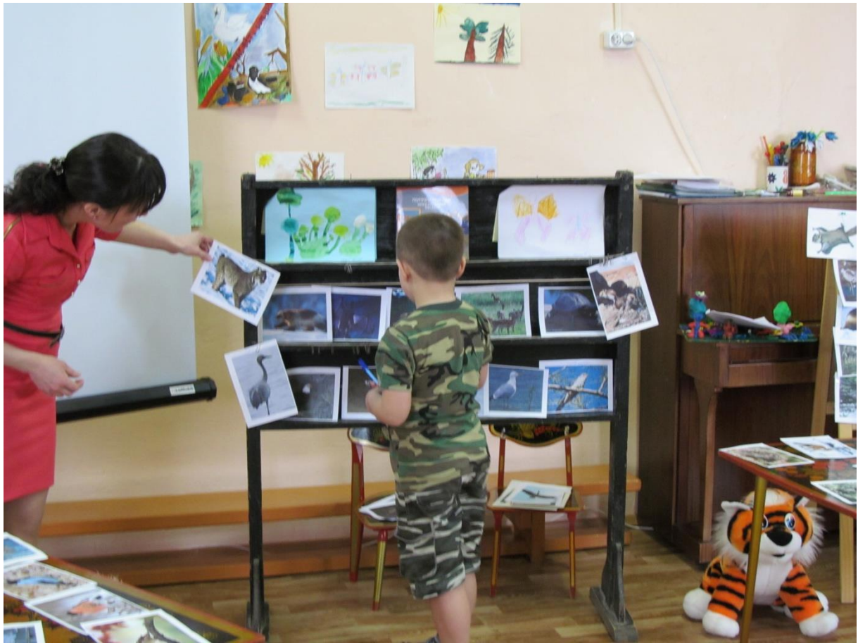
Конкурс 1 «Найди животное»