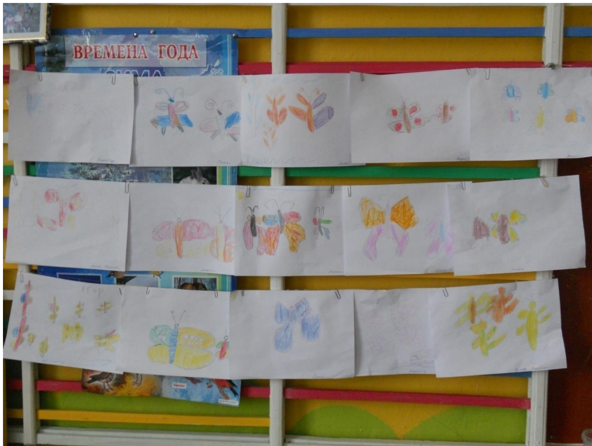
Выставка рисунков бабочек.