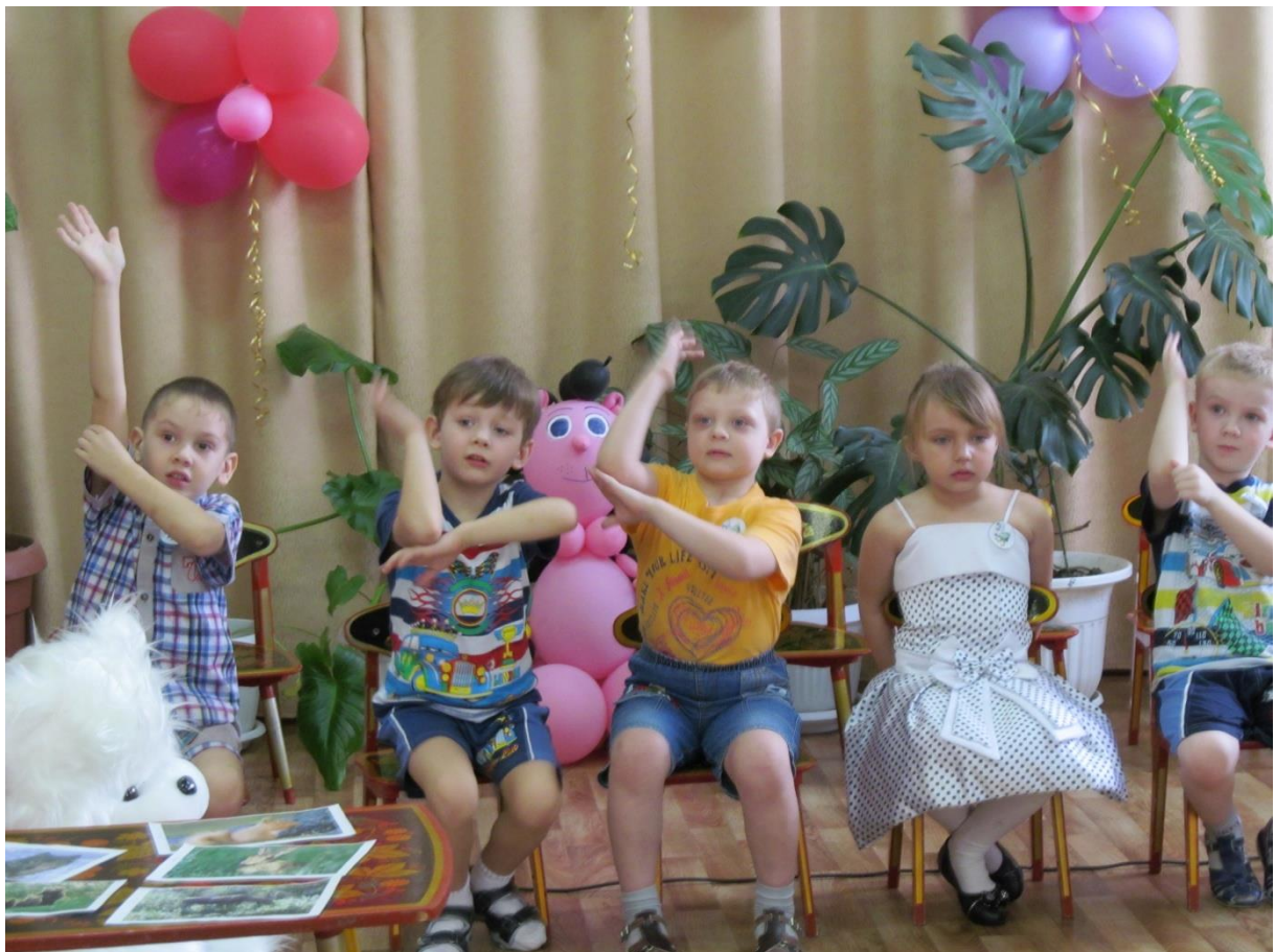
Конкурс 2 «Отгадай загадку»