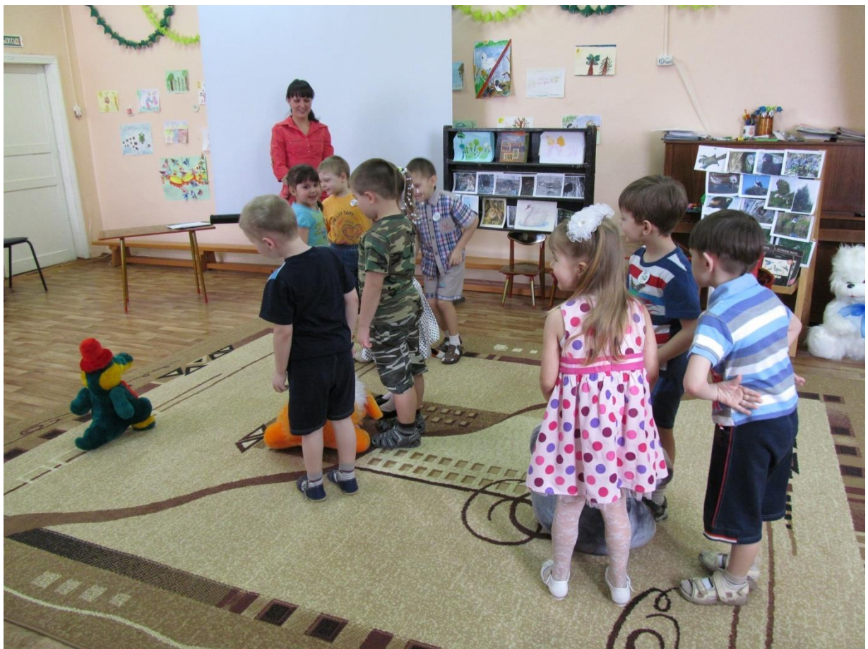
Подвижная игра «Найди свой домик»