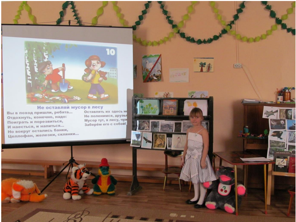
Вспомним правила поведения в лесу.