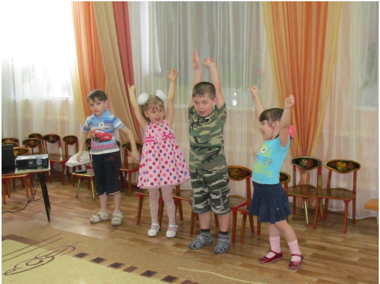
Конкурс 3 «Спортивный»